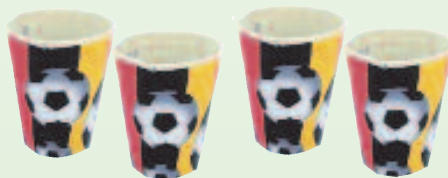
2941 Karton-Becher 0,2 l, 10 Stück, 2,15 €