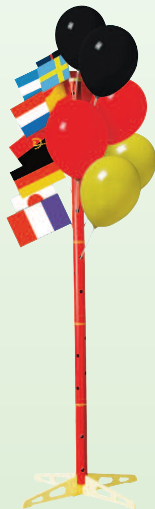
4320 Ballon- und Fahnenständer für 40 Ballons oder Papierfahnen, ca. 178 cm hoch, Kunststoff, 14 Teile im stabilen Stecksystem 24,85 €/Stück