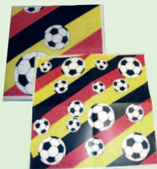
2939 Servietten Fußball 2-lagig, 20 Stück, 2,15 €