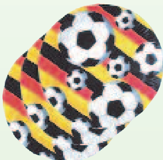
2942 Karton-Teller Ø 23 cm, 10 Stück, 2,15 €