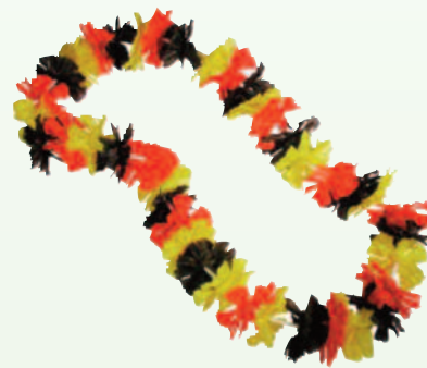
2353 Blütenkranz Textil, 7,80 €/6 Stück