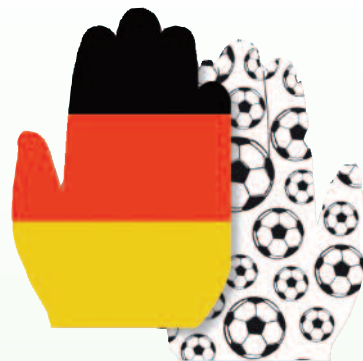
2931 Winkehände Karton, 23 x 34 cm, 2-seitig Deutschland/Fußball, 3,25 €/5 Stück