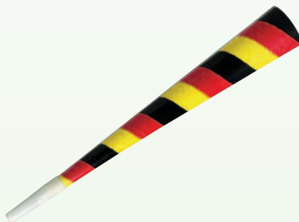
2919 Fantröte Karton, ca. 30 cm, 0,70 €